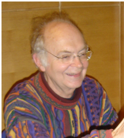
Donald Knuth.